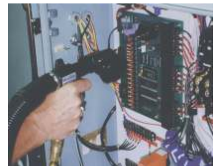
Aspiración de Polvos y Partículas Nocivas en Tableros Eléctricos