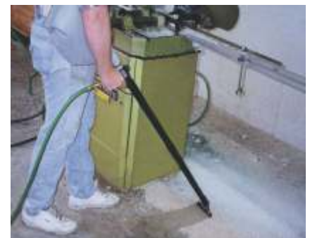
Pistola de Aspiración con Sistema de Bolsa Modelo BP6192

La Pistola de Aspiración es la opción más Eficiente para Soplar, Enfriar, Secar y Limpiar, frente a las pistolas estándar. En modo Aspiración, amplias variedades de superficies pueden ser fácilmente aspiradas produciendo un alto vacío que arrastre las partículas o desechos hacia un depósito. En modo Soplado, y con un diámetro de 32 mm, permite cubrir una mayor superficie en menor tiempo comparado con Pistolas comunes. Mediante la utilización de la manguera de vacío incorporada en el Kit, es posible también transferir materiales a largas distancias. Cuatro modelos con diferentes accesorios, se encuentran disponibles para uso con la Pistola, según la Aplicación.