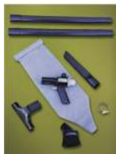
Modelo BP6192 Sistema de Recolección

BP6492: Idem Modelo BP6292 más Modelo 6850 Cobertor para Tambores