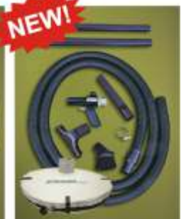
Modelo BP6492 Sistema de Transferencia para Tambor