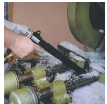
Rápida y Sencilla Aspiración de Virutas y Desperdicios