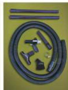
Modelo BP6292 Sistema de Transferencia