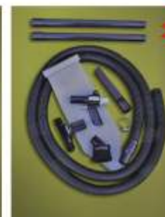
Modelo BP6392 Sistema Multipropósito